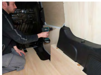
Placez et vissez la porte latérale Partie basse 5 vis 4x25