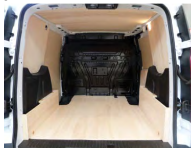
Votre Kit Utilitaire est posé !

NOTRE RESPONSABILITE NE SAURAIT ETRE ENGAGEE SUITE AU NON-RESPECT DES INSTRUCTIONS CI-DESSUS