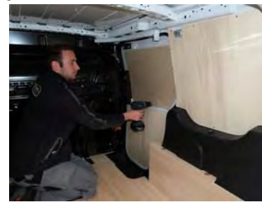
Placez et vissez la porte latérale Partie haute 6 vis 4x25