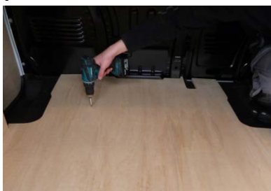
Placez & vissez le Plancher 6 vis 4x25