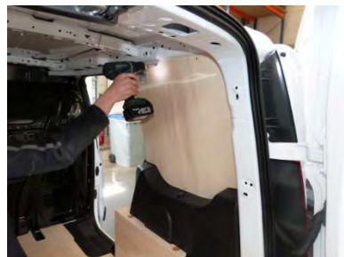
Placez & vissez le côté AR Droit 6 vis 4x25