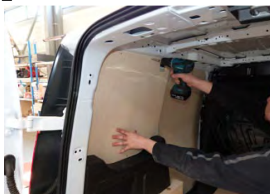
Placez & vissez le côté AR Gauche 6 vis 4x25