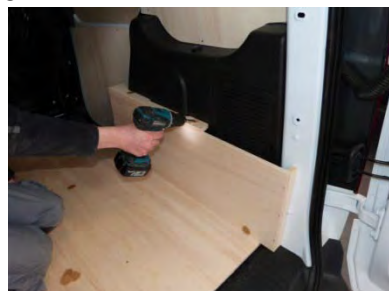
Placez et vissez le passage de roue Droit 4 vis 4x30