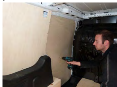
Placez & vissez le côté Av Gauche 7 vis 4x25