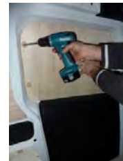
Placez & vissez le côté AV Gauche 4 vis 4x25