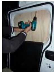
Placez et vissez la porte latérale Partie haute 4 vis 4x25