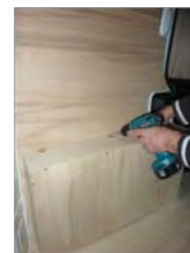
Placez et vissez le passage de roue Gauche 7 vis 4x30