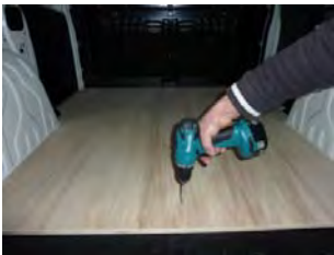
Placez & vissez les deux parties De plancher 9 vis 4x30