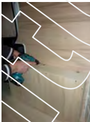
Placez et vissez le passage de roue Droit 7 vis 4x30