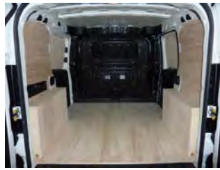
Votre Kit Utilitaire est posé !

NOTRE RESPONSABILITE NE SAURAIT ETRE ENGAGEE SUITE AU NON-RESPECT DES INSTRUCTIONS CI-DESSUS