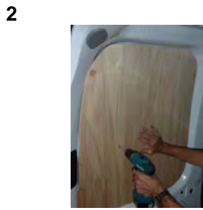
Placez & vissez le côté AR Gauche 6 vis 4x25