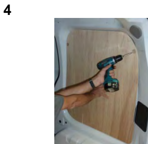
Placez et vissez le côté AR Droit 6 vis 4x25