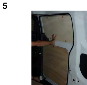
Placez et vissez la porte latérale Haut & Bas 10 vis 4x25