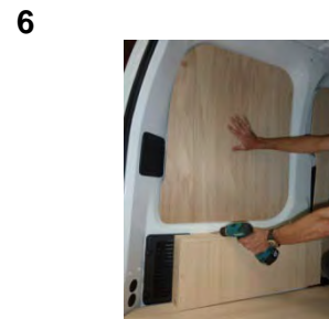
Placez et vissez le passage de roue AR Gauche 4 vis 4x30