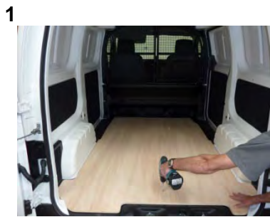
Placez & vissez le Plancher 7 vis 4x25

Attention ! : Cintrez les parties latérales, jusqu'à toucher la tôle (photos 2, 3 & 4), puis vissez. Les vis 4x30 , doivent servir, exclusivement à fixer les PDR (photos 6 & 7).