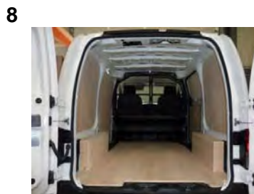
Votre Kit Utilitaire est posé !