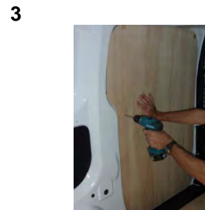
Placez & vissez le côté AV Gauche 7 vis 4x25