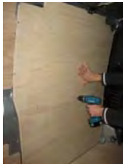
Placez & vissez le côté AV Gauche 7 vis 4x25