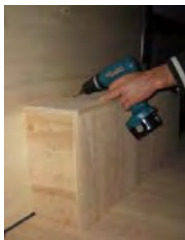
Placez et vissez le passage de roue Gauche 4 vis 4x30