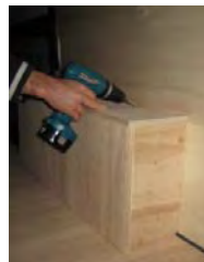
Placez et vissez le passage de roue Droit 4 vis 4x30