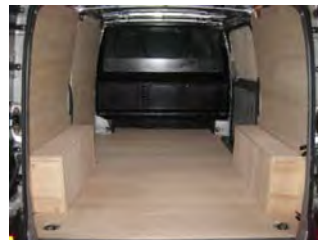
Votre Kit Utilitaire est posé !

NOTRE RESPONSABILITE NE SAURAIT ETRE ENGAGEE SUITE AU NON-RESPECT DES INSTRUCTIONS CI-DESSUS