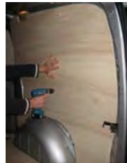
Placez et vissez le côté AR Droit 8 vis 4x25