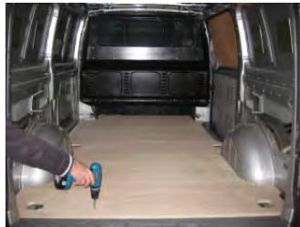
Placez & vissez le Plancher AR 6 vis 4x25