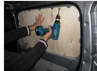
Placez et vissez la porte latérale Partie haute 4 vis 4x25