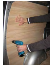
Placez & vissez le côté AR Gauche 9 vis 4x25