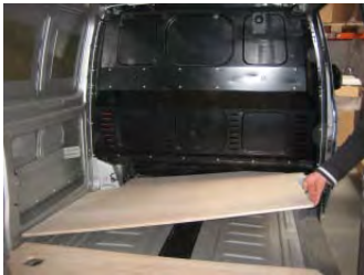
Placez & vissez le Plancher AV 6 vis 4x25