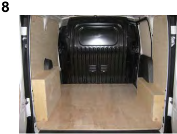
Votre Kit Utilitaire est posé !

NOTRE RESPONSABILITE NE SAURAIT ETRE ENGAGEE SUITE AU NON-RESPECT DES INSTRUCTIONS CI-DESSUS