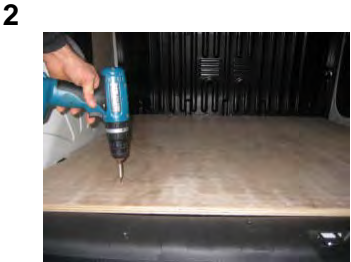
Vissez le Plancher 4 vis 4x25