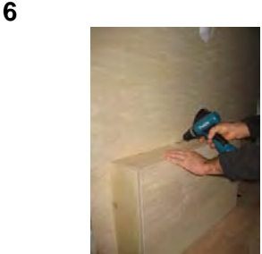
Placez et vissez le passage de roue Gauche 6 vis 4x30