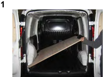
Placez, de biais le Plancher

Attention ! : Cintrez les parties latérales, jusqu'à toucher la tôle (photos 3 & 4), puis vissez. Les vis 4x30, doivent servir, exclusivement à fixer les PDR (photos 5 & 6).