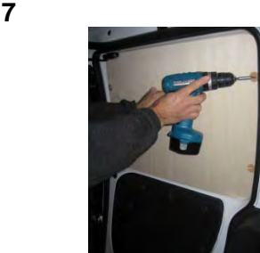
Placez et vissez la porte latérale Partie haute 4 vis 4x25