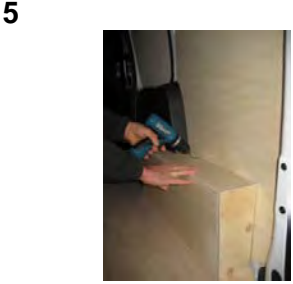
Placez et vissez le passage de roue Droit 6 vis 4x30