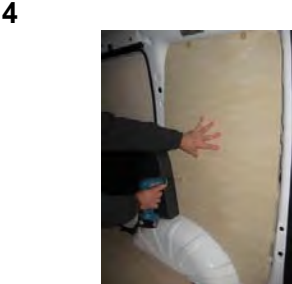
Placez & vissez le côté AR Droit 6 vis 4x25